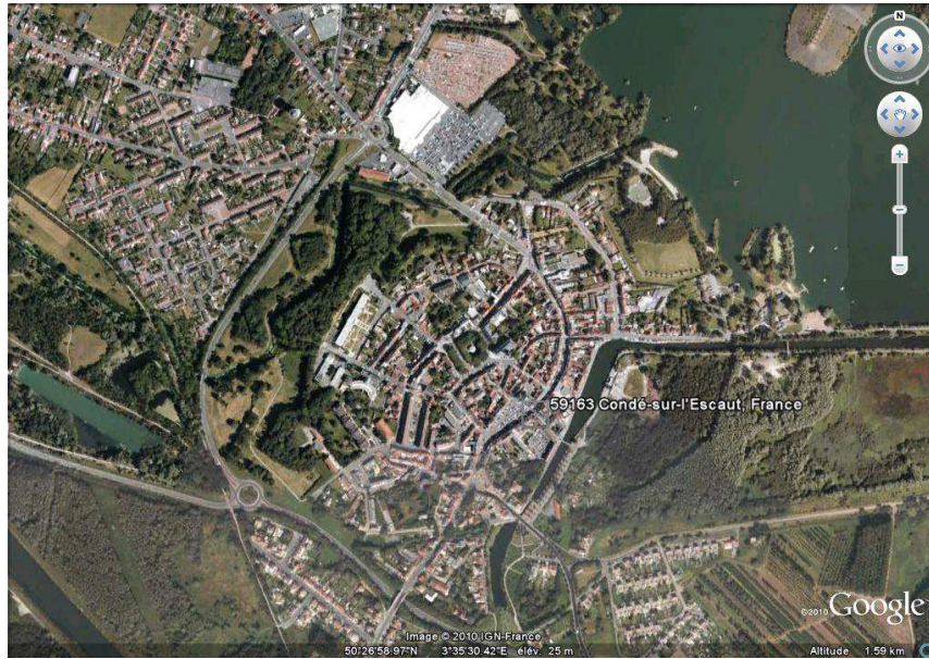
Vue aérienne de Condé-sur-l'Escaut, GoogleEarth, 25/07/2010.