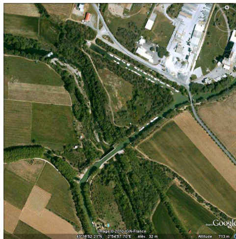
Vue aérienne du pont-canal de Mirepeysset, 17/08/2010.

Les pierres des appareils des arcs ont mal résisté à l'érosion provoquée par de nombreuses inondations. Les clés traversantes et le premier rouleau de l'arche centrale sur la façade en amont ont dû être reconstruits en calcaire coquillier au XIX e siècle. La façade aval n'a pas changé depuis le XVII e siècle.