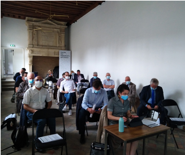
Le Conseil d'administration accueilli par le Centre des monuments nationaux à l'Hôtel de Sully

Le Réseau des sites majeurs de Vauban, qui fédère les douze fortifications de Vauban inscrites sur la Liste du patrimoine mondial de l'Unesco, s'est réuni à l'occasion de son conseil d'administration, au Centre des monuments nationaux/Hôtel de Sully (Paris), le 23 septembre 2020. Ce conseil d'administration accueillait ses nouveaux membres élus lors du scrutin municipal de l'année 2020.