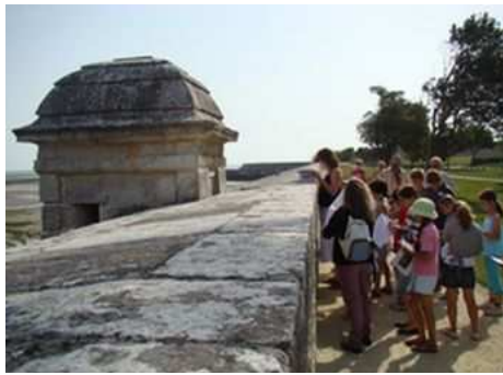
Atelier pédagogique sur les remparts de Saint-Martin-de-Ré

Prestigieux, emblématique...le label Unesco est de toute évidence une reconnaissance haute gamme de renommée mondiale qui fait la fierté de ses détenteurs. Mais suite à une telle inscription, les attentes toutes aussi légitimes mais plus pragmatiques des gestionnaires de site résident dans le souhait de voir un accroissement de la fréquentation touristique.