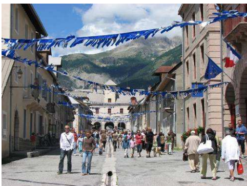
Les rues de Mont-Dauphin en fête