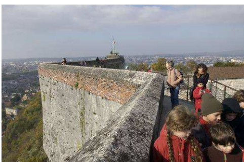
Visite sur le chemin de ronde de la citadelle de Besançon

Après fêtes et célébrations, l'heure est donc maintenant au bilan pour les fortifications de Vauban inscrites sur la Liste du patrimoine mondial le 7 juillet 2008.