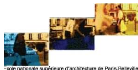
Ecole nationale supérieure d'architecture de Paris-Belleville