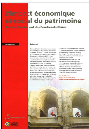
L'impact économique et social du patrimoine dans le département des Bouches-du-Rhône. Aix-en-Provence : Agence Régionale du Patrimoine Provence-Alpes-Côte-D'azur, 2007. 18p.

En 2009, à la demande du ministère de la Culture, cette étude a été étendue à l'ensemble de la France permettant une meilleure visibilité des retombées économiques du patrimoine, notamment en termes d'emplois.