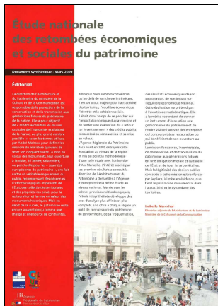
Étude nationale des retombées économiques et sociales du patrimoine. Aix-en-Provence : Agence Régionale du Patrimoine Provence-Alpes-Côte-D'azur, 2009. 34 p.

Cet ouvrage est une publication synthétique de ces débats. Cette publication est accompagnée d'un CD-Rom qui regroupe l'intégralité des débats.