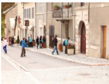
Conte Escarpe Médiation, septembre 2012

Création d'un outil de valorisation et de sensibilisation