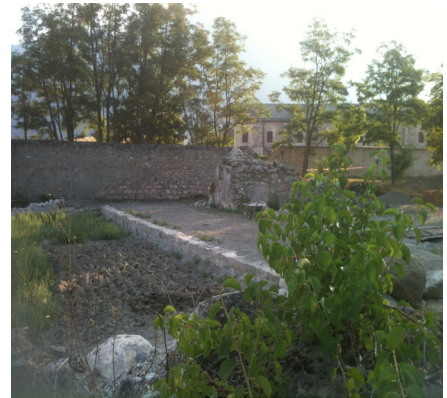
Mont-Dauphin, jardin Préparation des sols

Le jardin sera un support pour des actions de sensibilisation à l'environnement et à la réduction des déchets. Ainsi, la mairie de Mont-Dauphin souhaite mettre en place un partenariat autour du compostage autonome avec une école du Guillestrois. Il s'agit de faire trier par les élèves les déchets alimentaires produits par la restauration collective, leur faire gérer un compost et récupérer le compost produit pour alimenter le jardin.