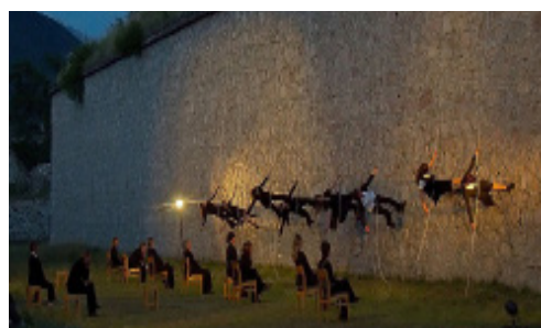
Vertical'été, juillet 2011

La place forte de Mont-Dauphin n'est pas seulement un site patrimonial, c'est également une commune de 142 habitants dont la trame urbaine est délimitée par ses fortifications. Le site a donc une double fonction : une ville et un lieu de tourisme culturel accueillant des manifestations estivales.