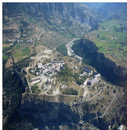
Mont-Dauphin, vue du ciel

En juillet 2008, les fortifications de Vauban, dont la place forte de Mont-Dauphin, sont inscrites sur la Liste du Patrimoine mondial. Il s'agit d'un seul bien comprenant douze sites choisis pour leur exemplarité au regard de l'ensemble de l'œuvre fortifiée de Vauban. Cette reconnaissance apporte une visibilité nationale, voire mondiale à ce patrimoine.