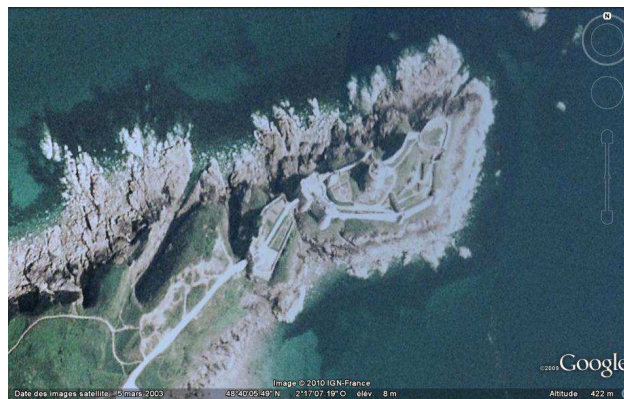
Vue aérienne du fort de la Latte (Cap Fréhel), 07/08/2010

En 1716, la chapelle Saint-Michel est construite en remplacement de celle datée du XV e siècle. Les murailles de la première enceinte sont rénovées et les tours du deuxième châtelet d'entrée sont remaniées au cours du XVIII e siècle. Un four à rougir les boulets est ajouté vers 1794. En 1805, le couronnement des tours s'effondre provoquant un arasement partiel. En 1890, le fort est déclassé et remis à l'administration des Domaines le 9 août de cette même année. Il est vendu en 1892 à des particuliers, puis, bien qu'en mauvais état, classé au titre des Monuments historiques en 1926 et ses abords en 1934.