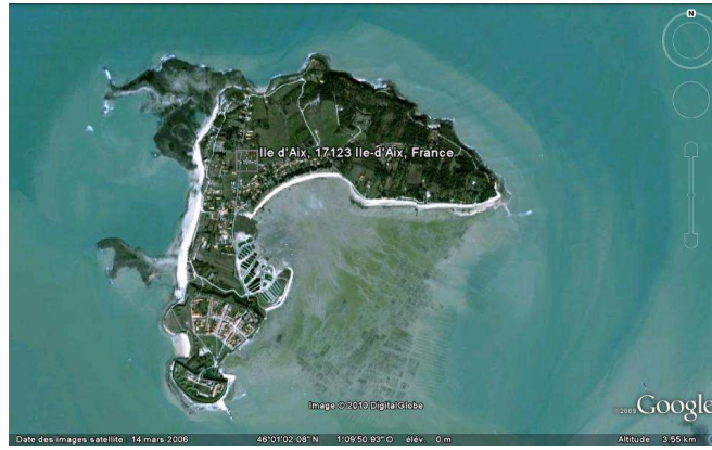
Vue aérienne de l'Île d'Aix, GoogleEarth, 08/08/2010.