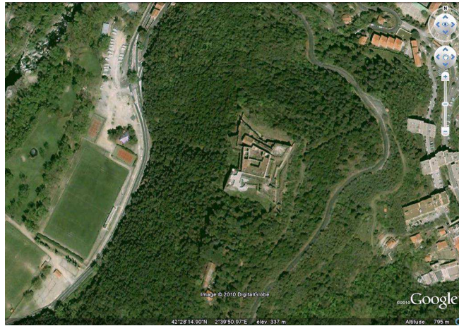
Vue aérienne du Fort-les-Bains, 30/07/2010.

Depuis la Révolution française, la ville d'El's Bany's d'Arles n'est plus sous la dépendance de l'abbaye d'Arles. En 1793, la garnison du fort se rend aux Espagnols, épuisée, manquant de vivres et de munitions après six semaines de siège. Le fort est occupé par l'armée jusqu'au XIX e siècle. En 1840, la ville prend son nom actuel en hommage à l'épouse de Louis-Philippe. En 1855, un hôpital militaire thermal est construit dans la commune. Classé au titre des Monuments historiques en 1909, le fort est mis en vente et racheté par des particuliers qui en font don en 1934 à l'association des Amis des blessés du poumon.