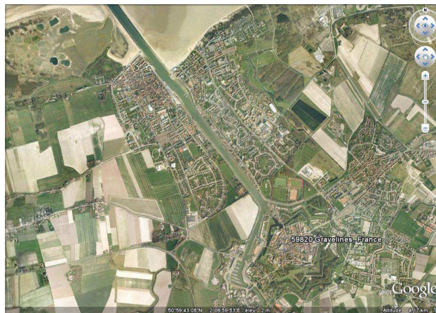
Vue aérienne de Gravelines, GoogleEarth, 28/07/2010.

Jusqu'au milieu du XVIII e siècle, les dehors de la place sont améliorés par l'adjonction de contre-gardes en avant des bastions exposés. Sous Louis XV, un projet de chenal, conçu par le roi d'Espagne Philippe IV, est mené à terme entre 1736 et 1740. Puis, de 1761 à 1852, quatre nouvelles digues sont créées. En 1871, l'écluse de Vauban est reconstruite, un bassin à flot est créé ; on établit le long de l'Aa des quais en charpente et on relève ceux du port d'échouage et du petit Fort Philippe.