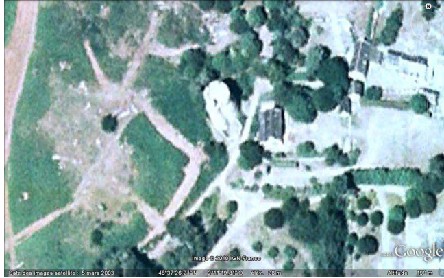
Vue aérienne de la tour des Hébihens, GoogleEarth, 05/08/2010.