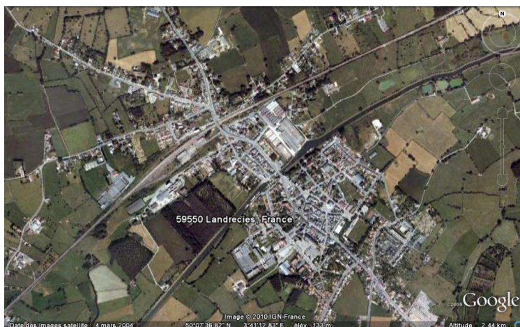
Vue aérienne de Landrecies, GoogleEarth, 09/08/2010.