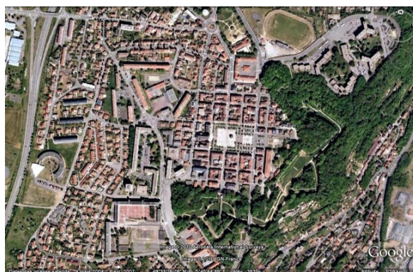
Vue aérienne de Longwy, GoogleEarth, 13/08/2010.

La place de Longwy perd de son importance après la prise et l'annexion du Luxembourg en juin 1684. Un mémoire de 1688 prévoit même de la désarmer. Mais le Luxembourg est restitué en 1697 et Longwy retrouve alors son importance militaire. Plusieurs bâtiments, dont l'hôtel de ville, ne sont bâtis qu'au XVIII e siècle et la ville n'en sera pas modifiée. Jusqu'à la guerre de 1870, le projet de Vauban ne subit que quelques modifications minimales, qui sont induites par les progrès de l'artillerie. Les principales créations sont la redoute à l'emplacement de l'ancien château médiéval et les lunettes qui prolongent les bastions de l'enceinte originelle. Intra-muros, la ville haute est dotée d'un nouvel hôpital et de nouvelles casernes. Du XVIII e siècle au milieu du XIX e siècle, la vie militaire occulte quasiment toutes les autres activités économiques, à l'exception de la faïencerie. Au cours du troisième quart du XIX e siècle, Séré de Rivières améliore les magasins casematés en les enterrant. Dès les années 1850, la ville de Longwy connaît un fort développement industriel.