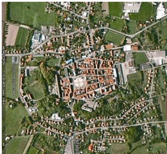
Vue aérienne de Phalsbourg, 25/08/2010