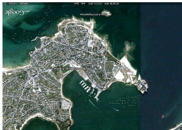
Vue aérienne de Port-Louis

Ville d'origine médiévale, Port-Louis, qui s'appelait Blavet à l'origine, reçoit ses premières fortifications modernes dans les années 1590, lorsque les Espagnols s'en emparent pour s'opposer à Henri IV de France et à Elizabeth I ère d'Angleterre. Don Juan del Aquila y construit un fort bastionné quadrangulaire : le Fort de L'Aigle. Ce fort est assiégé et pris par les Français en 1598. Henri IV envisage de démanteler la place mais Louis XIII la conserve et la reconstruit. Le fort est rebaptisé Saint-Louis et reçoit des bastions de mer en 1622 et une enceinte urbaine est établie au milieu du XVII e siècle. La ville est rebaptisée Port-Louis. La citadelle se présente sous la forme d'un carré à sept bastions, dont quatre à orillons, et précédée d'une demi-lune et d'ouvrages avancés. L'enceinte possède trois bastions pleins sur ses fronts terrestres. En 1683, Vauban visite le site. Son jugement concernant la citadelle et l'enceinte urbaine est très négatif mais il considère que le site lui-même compense la faiblesse des défenses du port devenu l'arsenal de la Compagnie des Indes, créée par Colbert en 1664. Il se limite donc à la création d'un magasin à poudre enclos dans un mur, d'un arsenal, d'échauguettes et de refaire le fronton de la porte principale de la citadelle. La demi-lune de Louis XIII est remplacée par l'actuelle.