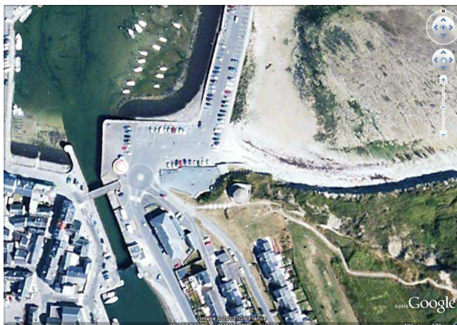
Vue aérienne de la tour de Port-en-Bessin entourée du port et du village, GoogleEarth, 25/08/2010.