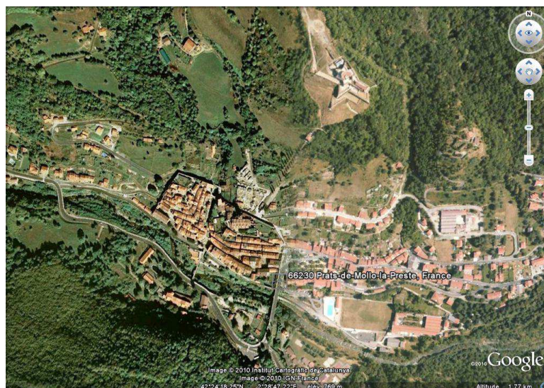
Vue aérienne de Prats-de-Mollo, GoogleEarth, 27/08/2010.

Vendu par l'armée en 1920, le fort Lagarde est classé au titre des Monuments historiques en 1925. La ville l'achète en 1976 et entreprend sa restauration en 1982. Un musée dédié à la fortification et à l'histoire militaire y a ouvert depuis les années 1990.