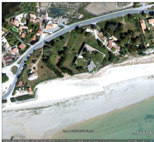
Vue aérienne de la redoute de Martray, GoogleEarth, 15/08/2010.