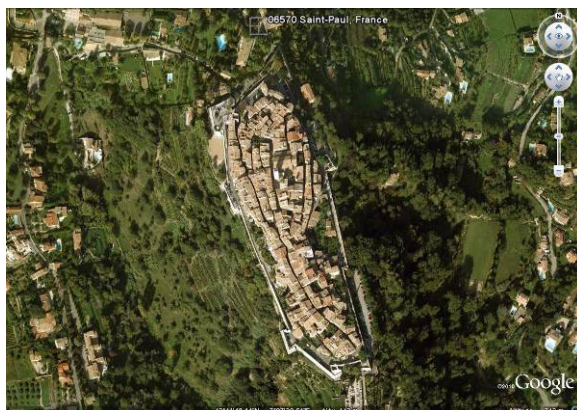
Vue aérienne de Saint-Paul-de-Vence, GoogleEarth, 01/09/2010.