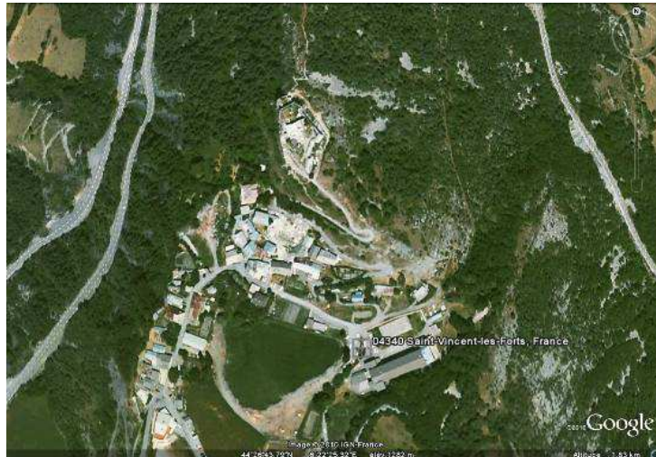
Vue aérienne de Saint-Vincent-les-Forts, GoogleEarth, 01/09/2010.

autour du village en dessinant un rempart à tours bastionnées semi-circulaires, et préconise la construction de casernes. Vauban projette l'ajout d'une seconde tour de guet, plus grande et plus éloignée. Faute d'argent, seules des corrections de détails sont réalisées. La tour supplémentaire et l'enceinte ne seront jamais réalisées, d'autant plus que l'Ubaye devient française en 1713, réduisant l'intérêt du fort de Saint-Vincent. Durant le XVIII e siècle, le fort est abandonné. Il retrouve une certaine utilité militaire pendant la Révolution Française, ce qui justifie sa restauration sous la Monarchie de Juillet (1830-1848). Restauré et légèrement réaménagé au cours du XIX e siècle, le fort est finalement déclassé en 1880 et remplacé par deux autres forts et une batterie, situés à plus haute altitude.