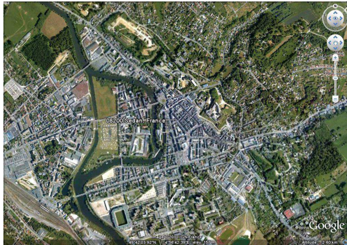
Vue aérienne de Sedan, GoogleEarth, 01/09/2010.