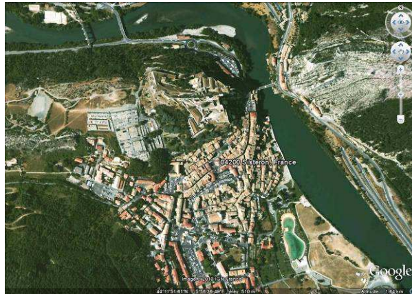
Vue aérienne de Sisteron, GoogleEarth, 03/09/2010.