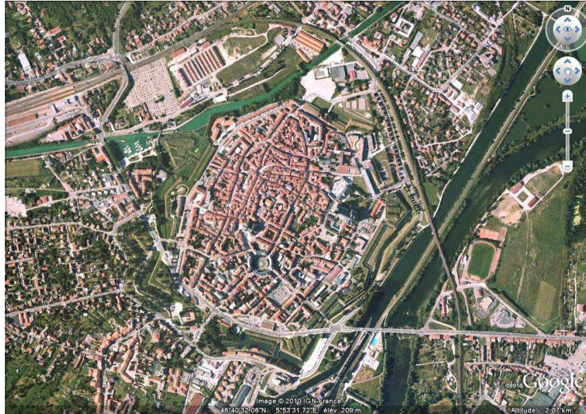
Vue aérienne de Toul, 16/09/2010.

Le parement de la contrescarpe n'est réalisé qu'au XIX e siècle et seules trois des demi-lunes ont été bâties. Le parement des escarpes est endommagé pendant le siège prussien de 1815 et remplacé une fois la guerre finie. Entre 1872 et 1874, Séré de Rivières construit une ceinture de six forts périphériques autour de la ville. Organisée et composée de grands ouvrages polygonaux semi-enterrés, elle devait garantir la défense de la « Trouée de Lorraine » chère à la III e République.