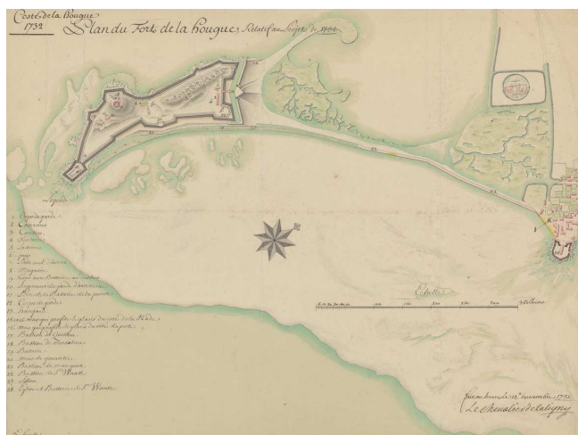
Plan du fort de la Hougue relatif au projet de 1732.